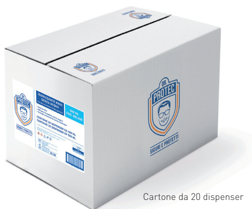
Cartone da 20 dispenser

Alcohol denat., Aqua, Propylene, Glicol, Carbomer, Aminomethyl propanol, Citrus aurantium Bergamia fruit oil, D-Limonene, Linalool.